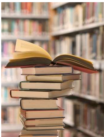
図書の自動貸出機