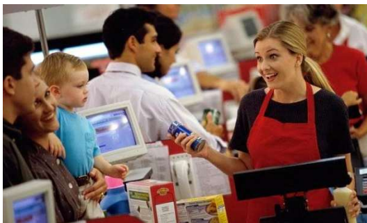
レジカウンターでの一括精算